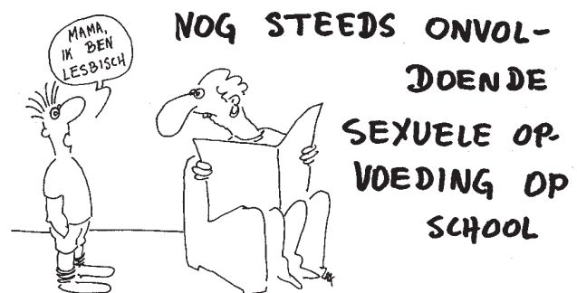
Zak, uit de Zwijger, 22 juni '83.

Harvey Fierstein tijdens de openingsceremonie van de Gay Games, 1 augustus 1998