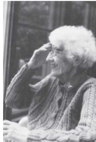
May Sarton, 1994.

mijzelf, hij is en hij is niet", vond May later zelf van het werk. De middag bij Virginia was pijnlijk. May vond Virginia gekunsteld en kon daar niet doorheen dringen. Virginia raadde haar aan essays te schrijven. 10