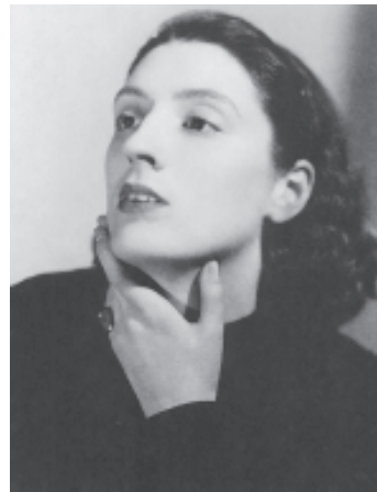
Publiciteitsfoto voor het 'Apprentice Theatre', 1932.