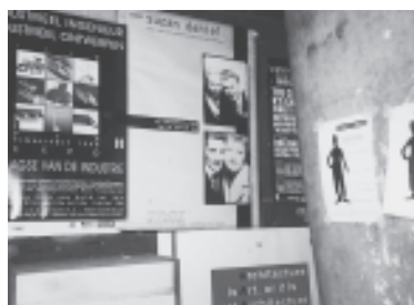
Affiche campagne.

En 1998 le Fonds Suzan Daniel a investi beaucoup de temps et d'énergie dans le 'project archiefsensibilisering', avec lequel nous avons essayé d'augmenter l'importance qu'attachent les producteurs d'archives, à leurs propres archives, au patrimoine gai/lesbien