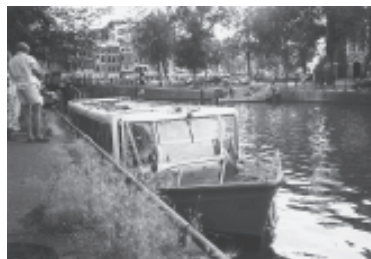
De Fuut. Op de achtergrond het homomonument.

Aan het Anne Frank Huis werd even ingegaan op Annes lesbische gevoelens en je kreeg ook te horen waar zich momenteel een reeks van gay winkeltjes aan het vestigen is. Of waar fotograaf Jan Carel Warffemius zo ongeveer woonde en hoe belangrijk zijn historische homo/lesbische fotocollectie wel was. Tussendoor kreeg je even