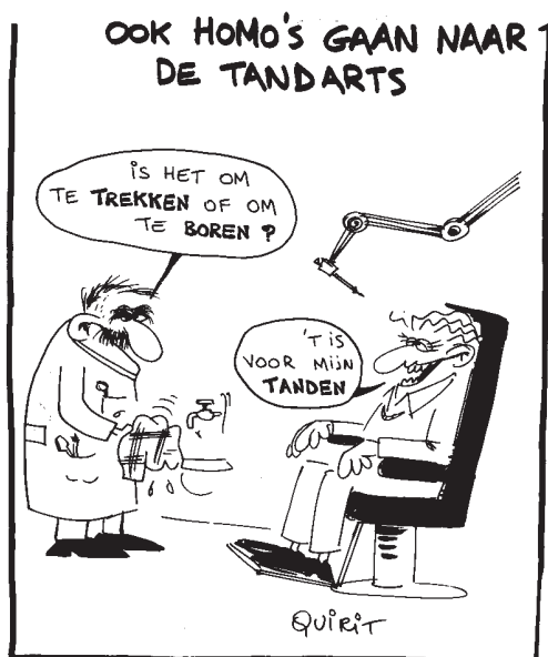
Tekening uit De Zwijger (17/02/1982), overgenomen in De Homokrante, maart 1982, p.17.