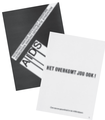
2 AIDS-voorlichtingsfolders, uitgegeven door FWH (midden jaren '80)

De opkomst van AIDS had vanzelfsprekend ook gevolgen voor de homo- en lesbiennebeweging. Dat de FWH in het midden van de jaren '80 ten gevolge van interne crises zelf ternauwernood overleefde, verklaart misschien waarom in het archiefbestand niet zoveel terug te vinden is van haar werking op dat terrein. De Federatie speelde echter zeker een rol bij de informatieverbreiding: door het verdelen van folders via en het opnemen van artikels in De Homokrante, door de aanwezigheid op informatiemarkten, door het zelf uitgeven van folders (zie HOB1, p. 8),... Ze promoveerde het gebruik van condooms en verkocht ze zelf. Daarnaast was ze medeoprichter van de Stichting AIDS Gezondheidszorg (StAG, de vereniging achter de Aids-telefoon), en nam ze zelfs een tijdschrift hiervoor het secretariaat waar. Natuurlijk onderhield ze daarnaast ook contacten met de andere organisaties die werkzaam waren rond preventie, opvang,... en verwees ze naar hen door. Bovendien was ze vertegenwoordigd in bijvoorbeeld de Provinciale AIDS Coördinatie Commissie (PACC) van de provincie Antwerpen of het Stedelijk Overleg AIDS Antwerpen (SOAA).