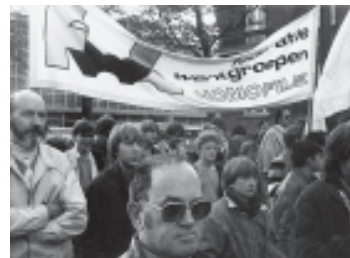
De FWH aanwezig op een of andere manifestatie, zonder datum.

Maar ook op dit vlak betekende de interne crisis van het midden van de jaren tachtig een terugval.