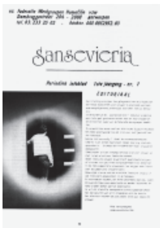
Het allereerste nummer van Sanseveria , 1984.

In verband hiermee organiseerde de FWH in september 1978 een studieweekend voor en door vrouwen met als thema 'Vrouwen in de Vlaamse homofiele beweging'.