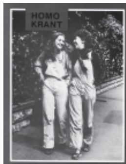
Homokrante, juni 1982

De bundeling van de afzonderlijke nieuwsbrieven tot Infoma-Nieuws was een neveneffect van dat ontstaan van Infoma. Alhoewel het nieuwe, gestencilde blad vooral de activiteitenkalender van de diverse groepen bevatte, en bijgevolg meer een interne functie vervulde, hoopte men toch dat het mettertijd zou "uitgroeien opdat het te zijner tijd als een volwaardige spreekbuis van de homofiele groep in de heterofiele maatschappij zal kunnen optreden".