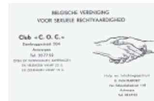
visitekaart BVSR (eind jaren '60)

Persoonlijke tegenstellingen en ambities, maar ook meningsverschillen over de manier waarop gewerkt moest worden, resulteer-