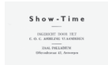
Uittreksel uit het programmaboekje van 'Show-Time' door COC-Vlaanderen (midden jaren '60)