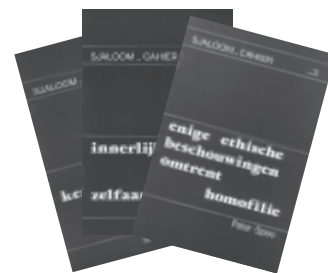
3 cahiers uitgegeven door Sjaloom (1976)