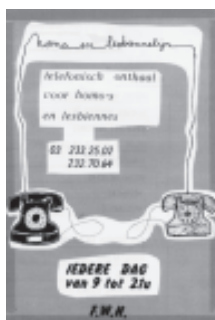
Telefonisch onthaal, eerste helft jaren '80.

In elk geval is het uiteindelijke resultaat van enkele decennia arbeid een omvangrijke collectie archief- en documentatiemateriaal: een 350-tal nationale en internationale tijdschrifttitels (soms slechts een enkel nummer, maar ook hele reeksen), documentatiemappen over bijvoorbeeld film, theater of literatuur, een vijftiental classeurs met thematisch ingedeelde knipsels, ..., naast de tientallen archiefdozen die de eigen werking van de FWH illustreren.