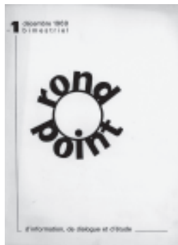
Rond Point, la revue du C.C.L. de Bruxelles

Le CoHom était une tentative vouée à l'échec. Il y avait beaucoup trop de querelles et peu de discipline. Les associations considéraient les réunions plénières comme une perte de temps et un verbiage inutile. Ajoutez-y la barrière linguistique et une mentalité différente entre néerlandophones et francophones – ces derniers en plus étaient souvent très divisés – et il est clair que le CoHom ne pouvait pas vraiment réussir.