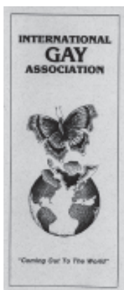
Dépliant de l'IGA, 1979.

Dans les années soixante et septante les différentes associations flamandes invitaient donc des conférenciers néerlandais, recevaient les brochures et revues de nos voisins du nord, assistaient à leurs réunions. Par exemple, un représentant d'Infoma, un devancier de la FWH actuelle, était pendant quelques années présent aux réunions du bureau du COC des Pays-Bas, qui se déroulaient chaque mois à Utrecht.