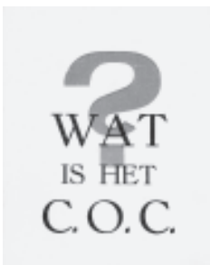
Infobrochure van de BVSR (1968)