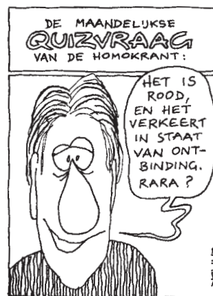
Tekening uit De Homokrant, november 1981, p. 8, naar aanleiding van de ontbinding van de Rooie Vlinder

het Fonds Suzan Daniel heeft een vormingsprogramma uitgewerkt rond de allereerste Belgische TV-programma's die homofilie als onderwerp hadden: contacteer ons voor bijkomende inlichtingen en/of reservaties