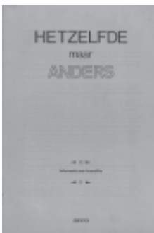
Hetzelfde maar anders, in 1972 uitgegeven door Acco