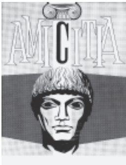
Amicitia, het gemeenschappelijke tijdschrift van CCL-COC en COC-Vlaanderen (1962-1965)